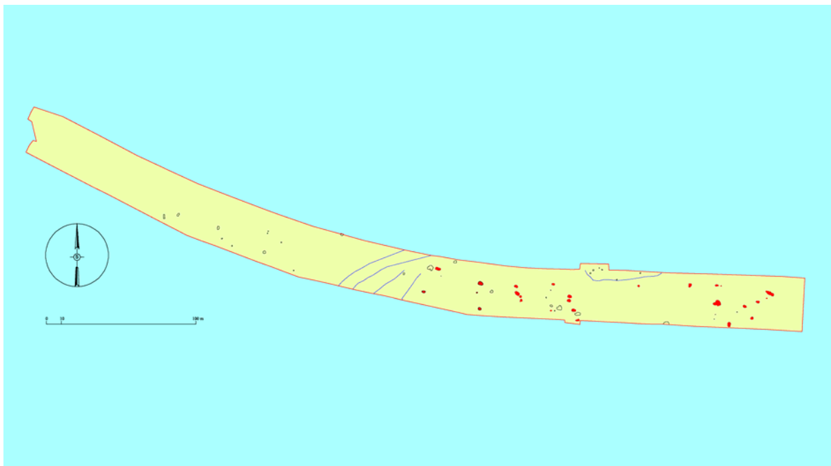
Slika 1: Grofovsko. Območje izkopavanja z označenimi zgodnjesrednjeveškimi objekti (Načrt: Sašo Poglajen)

V objektih iz zgodnjega srednjega veka smo poleg številne lončenine, našli okrasno ploščo konjske opreme ( 1 , sl. 2), glineni vretenci (SE 127/1, SE 157/5) in tri steklene jagode (SE 127/2a, b, SE 137/4) poleg tega pa z izpiranjem vzorca še koščke živalskih kosti, številne drobce oglja in ostanke hrane.