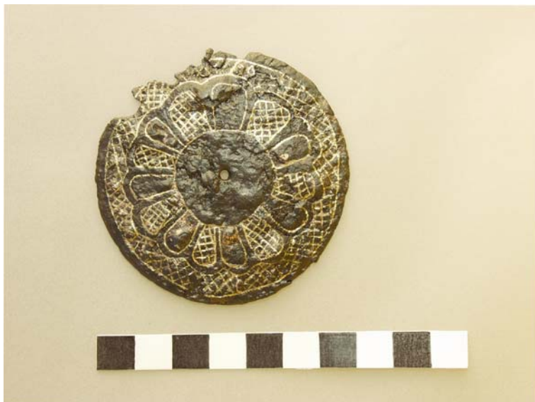
Slika 2: Grofovsko. Železna okrasna plošča konjske opreme iz objekta SE 123

V objektih iz zgodnjega srednjega veka smo poleg številne lončenine, našli okrasno ploščo konjske opreme ( 1 , sl. 2), glineni vretenci (SE 127/1, SE 157/5) in tri steklene jagode (SE 127/2a, b, SE 137/4) poleg tega pa z izpiranjem vzorca še koščke živalskih kosti, številne drobce oglja in ostanke hrane.